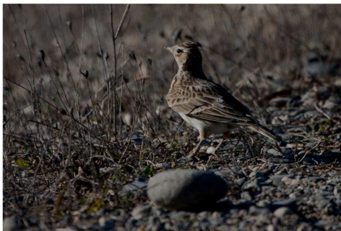
Alouette des champs