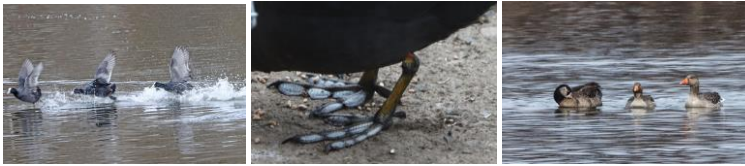
Foulques ( pattes )

Quelques passereaux : pinsons du nord, verdiers, chardonnerets à la mangeoire, geai ..... et un rat musqué qu'on avait pris pour un ragondin