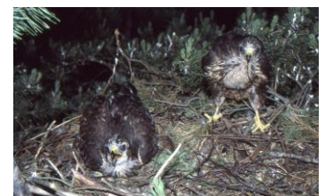
Buse Juvéniles au nid