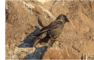
Choucas des tours

Pedro a fourni des photos prises ces derniers temps à l'écopole