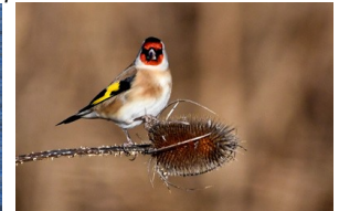
Chardonneret sur cardère