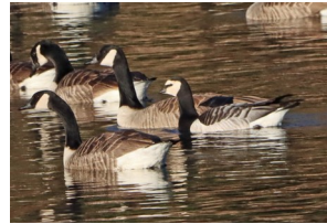
Bernache nonnette ( à droite )