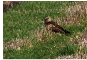
Busard St Martin