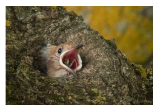
Huppe fasciée ( nourrissage )