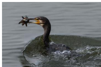
Grand cormoran ( poisson chat )