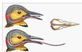
Fig.3 Configuration de l'os hyoïde chez les Picidés

Daniel Zorn nous a montré une vidéo très instructive sur les recherches de nourriture des pics