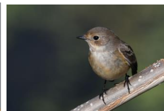
Gobe mouche noir