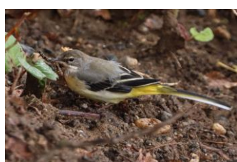
Bergeronnette des ruisseaux