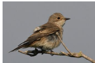
Gobe mouche gris