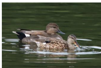
Canard chipeau ( miroir blanc )