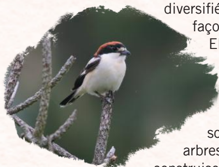
Pie-grièche à tête rousse

Les pies-grièches affectionnent les paysages diversifiés de bocage, façonnés par l'élevage. Elles apprécient les prairies riches en fleurs, entourées de haies et ponctuées d'arbres isolés. Ce sont d'ailleurs dans ces arbres et arbustes qu'elles construisent leur nid.