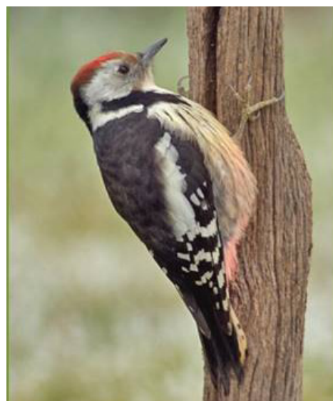
Pic mar - Danielle Carlier

Remarque : Cet hiver, le Pinson du Nord, espèce hivernante normalement assez fréquente en Auvergne, n'a été que très peu observé sur la région et les résultats de ce comptage confirment cette tendance avec seulement 18 individus comptés contre 114 l'an dernier.