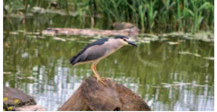
Bihoreau gris - LPO Auvergne

Le Groupe Local de Vichy organise une balade autour du réveil printanier à l'ENS de la Boire des Carrés où vous longerez l'Allier depuis Charmeil pour rejoindre les boires. Une balade agréable vous attend.