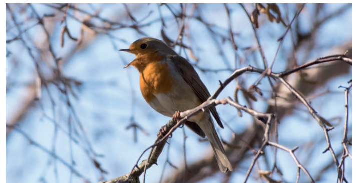
Rougegorge - Christian Taillandier

Accompagnés par les bénévoles du groupe local LPO Chaîne des Puys, venez observer les oiseaux et écouter les chants d'oiseaux en ce début de printemps autour de l'Abbaye de Randol.