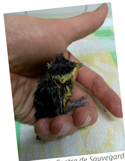
Oisillon du Centre de Sauvegarde Crédit : LPO Auvergne

http://www.lpo-auvergne.org/la-lpo-auvergne/centre-de-sauvegarde